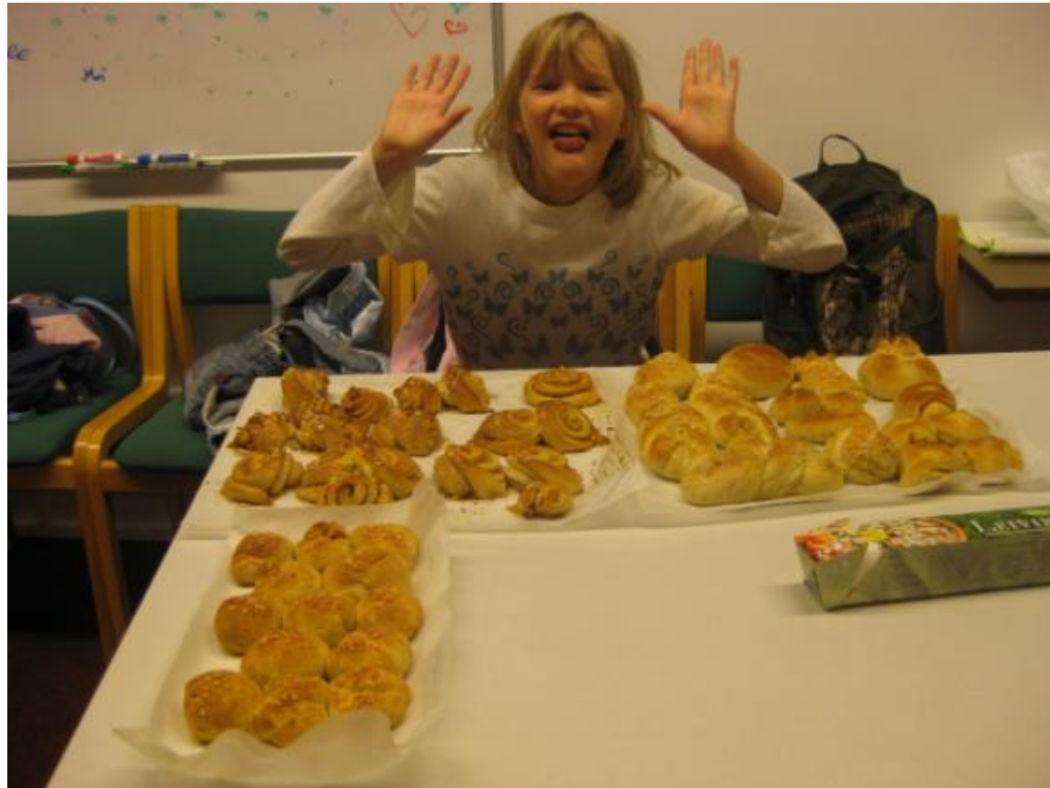
Leirillä leivottiin pullaa